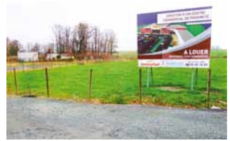
Cette future ZA accueillera Kéolis TVL

A ces nouvelles rotations, s'ajoutent des projets d'extension du réseau actuel, une volonté politique des donneurs d'ordre qui a déjà donné lieu à la mise sur route de 4 nouveaux véhicules sur la ligne 46. Le service en nocturne complète ce dispositif. C'est dire si l'idée – pour