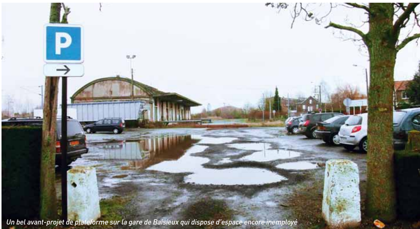
Un bel avant-projet de plateforme sur la gare de Baisieux qui dispose d'espace encore inemployé

« C'est un bel ensemble tout ça d'autant que Lille manque d'espaces verts. »