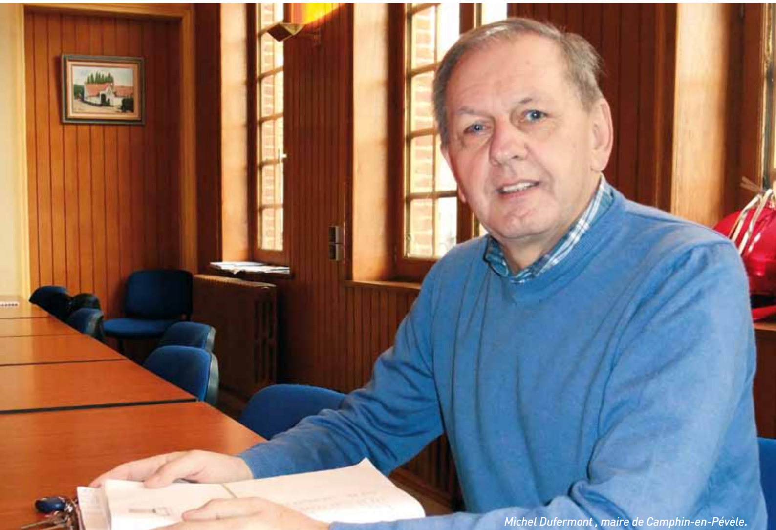
Michel Dufermont, maire de Camphin-en-Pévèle.