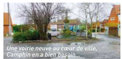
Une voirie neuve au cœur de ville, Camphin en a bien besoin...

Michel Dufermont s'est donc attelé à la tâche et tandis qu'il continue de mener en son centre ville des opérations de préservation du patrimoine bâti, il a lancé un vaste chantier de modernisation des voiries. La départementale 93 a déjà fait l'objet de lourds travaux sur 2,3 km entre 2006 et 2008. Mais un projet plus ambitieux naît avec une nouvelle place de village et des abords