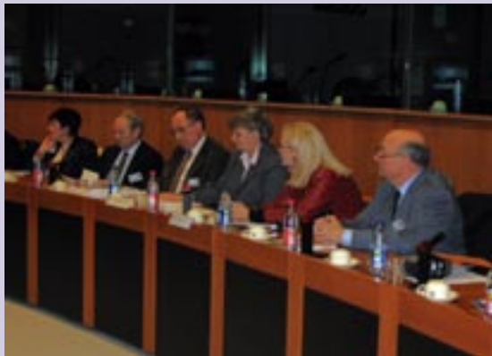
Au Parlement européen