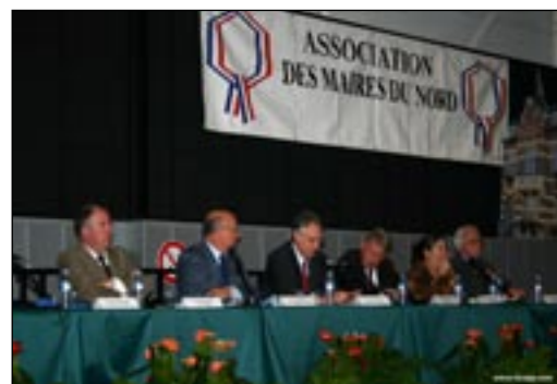
A la tribune