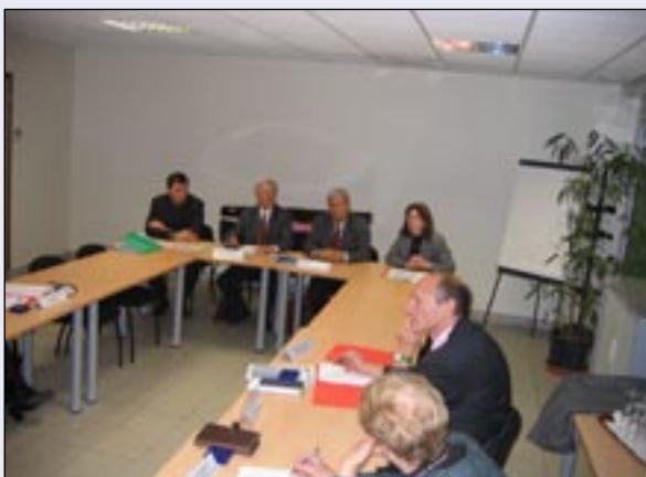
Réunion du CA au siège de l'AMN