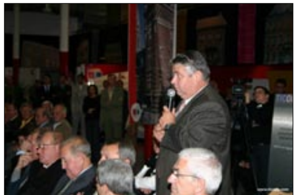
Le Maire d'Erquinghem/Lys