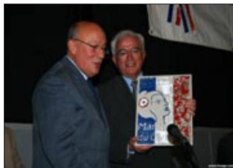
La remise des Trophées de la Marianne du civisme