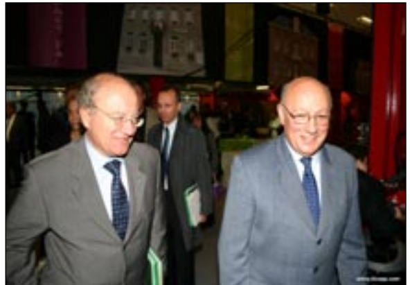
Le Préfet et le Président de l'AMN