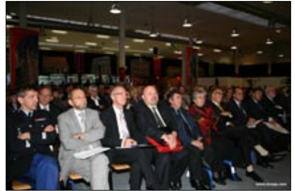
L'Assemblée en plénière

- les trophées des Mariannes du Civisme, récompensant 7 communes du Nord pour la participation aux élections de 2007 (voir MEN n°21)