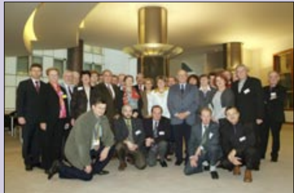
La délégation des Maires du Nord